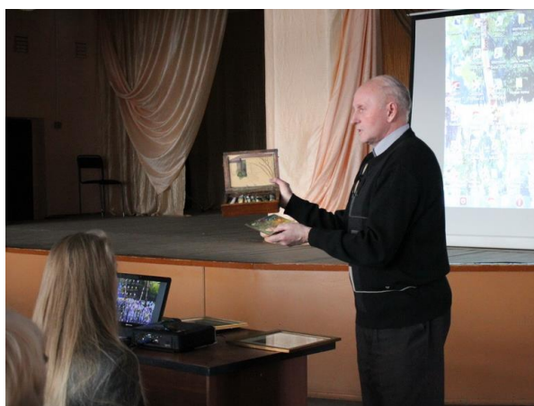
Этюдник В. О. Кирикова

14 декабря 2014 г на краеведческой конференции «Голышевские чтения» приятный подарок вручил МХ музею Евгений Владимирович Кириков. Почти год как не стало дочери В.О. Кирикова, но из её коллекции в дар музею были подарены этюдник с красками и палитрой самого Василия Осиповича Кирикова – реставратора Третьяковской Государственной галереи, иконописца, художника. Подарена Афиша 1958 г. об открытии персональной выставки В.О. Кирикова, автопортрет В.О. Кирикова (сангина 1940-е г.). И 2 картины – дочь «Лиля на этюдах в Мстёре на речке Старице» (1950) и «Пейзаж» (1950 – е г.). На открытии выставки Е.В. Кириков презентовал гостям контрольный экземпляр книги «В.О. Кириков – реставратор, художник, копиист». В адрес Юбиляра было сказано много теплых слов, так как присутствовали художники, лично знавшие В.О. Кирикова – это Л.А. Фомичев – народный художник России, Лауреат Государственной премии им. И.Е. Репина. Художники, побывавшие в 1972 г на выставке В.О. Кирикова в Москве. - Заслуженный художник России В.К. Мошкович, Заслуженный деятель искусств Б.М. Вифлеемский, В.А. Курчаткин. Все отметили удивительную скромность В.О. Кирикова, интересную художественную манеру исполнения, удивительно мягкий гармоничный колорит произведений.