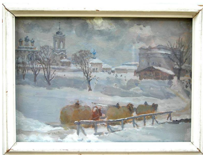
Зимой во Мстёре. 1960г.