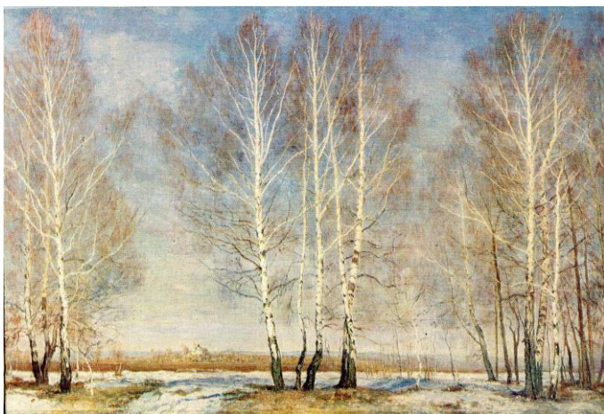
Весенняя сказка. Турист.

Картина «Весенняя сказка. Турист» является пейзажем настроением. Шелестят берёзки на ветру на фоне голубого неба. Убегающая вдаль тропинка создает на душе, какую-то особую легкость.