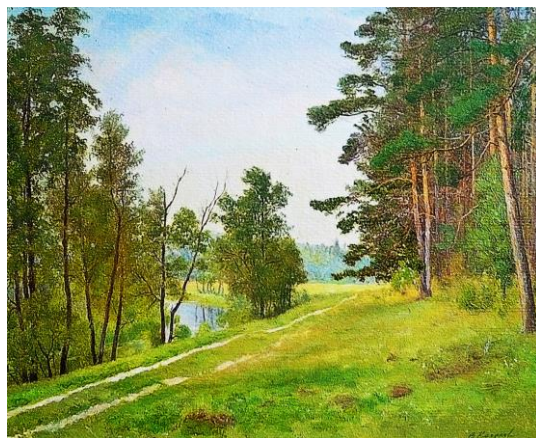
Река Тара. Сосновый лес. 1970 г.

Приказом по Министерству культуры РСФСР от 13 сентября 1973 г. в фонды Мстёрского художественного музея было передано 14 художественных произведений автора В.О. Кирикова. А в течение декабря они были получены. И уже на протяжении 42 лет являются несомненной гордостью музея. В них много красивых, возвышенных поэтических чувств, светлой радости, неподдельной искренности.