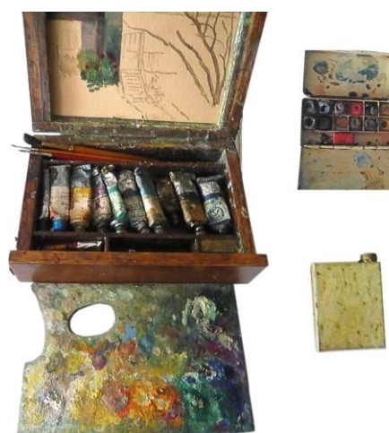
Этюдник В.О. Кирикова