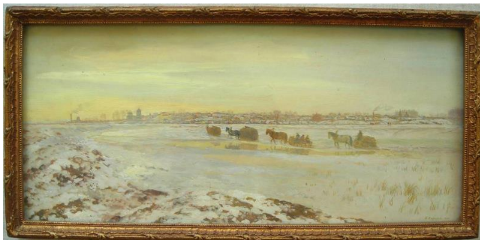
Моя родина. Мстёра. 1946г.

Если в первой картине мы видим панорамное изображение, то в картине «Зимой во Мстёре» показан фрагмент, обоз с сеном переезжает по мосту через речку Мстёрку, которая находится подо льдом. А величественные соборы стоят на крутом заснеженном берегу.